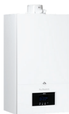
MPX 2 / MPX 2 COMPACT